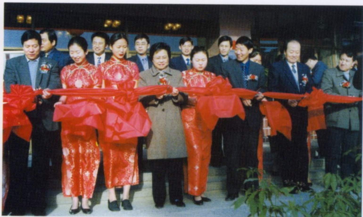
3月8日，省委副书记、省人大常委会副主任范肖梅为我校校园网开通剪彩