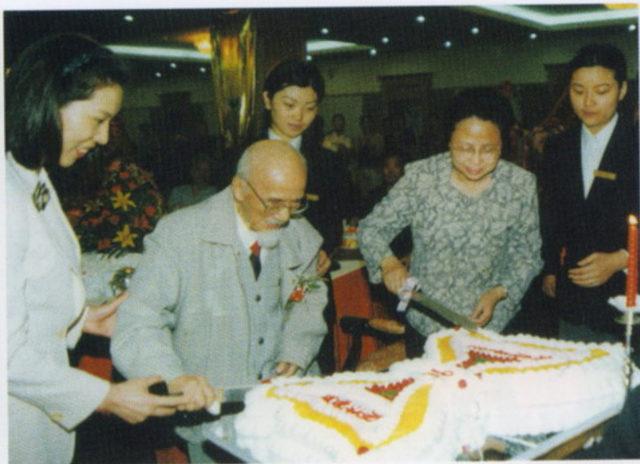
6月8日，学校隆重庆祝周尧教授九十华诞