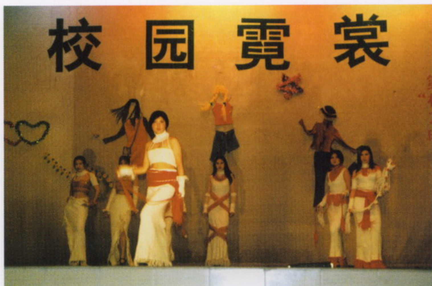
4月18日，学校举行第二届“校园之春”文化艺术节