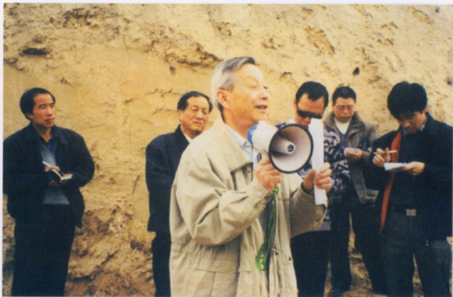
山仑院士在中宣部组织的“科技下乡西部行”活动中