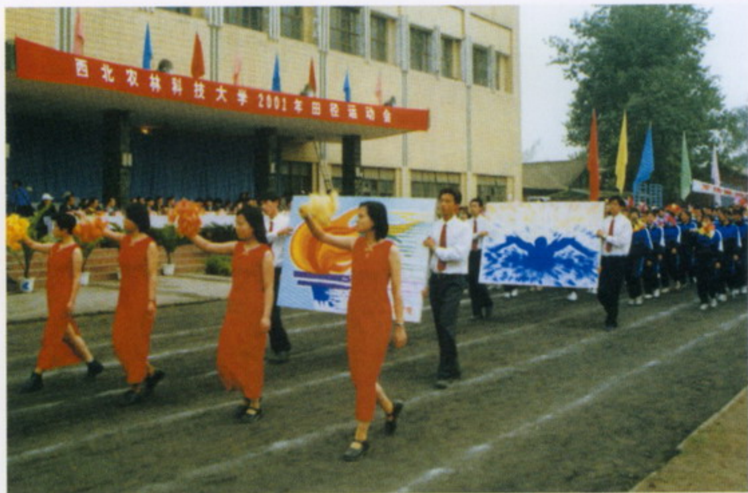
4月19日，学校举行田径运动会开幕式