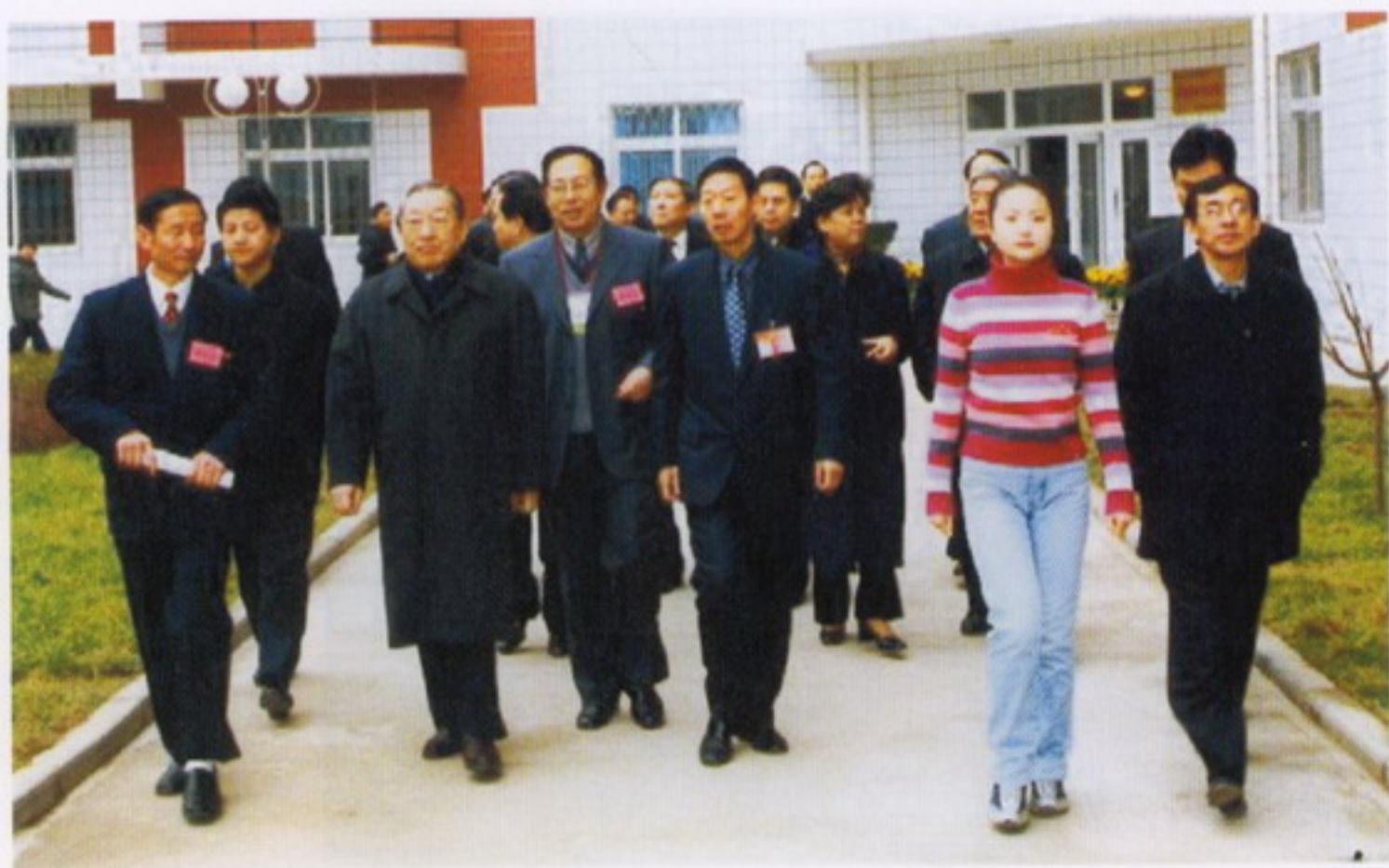
12月7日，中共中央政治局常委、国务院副总理李岚清视察我校