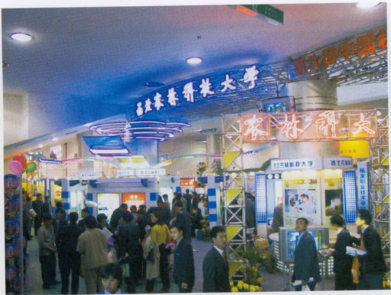
11月5日，学校参展第八届中国杨凌农业高新技术博览会