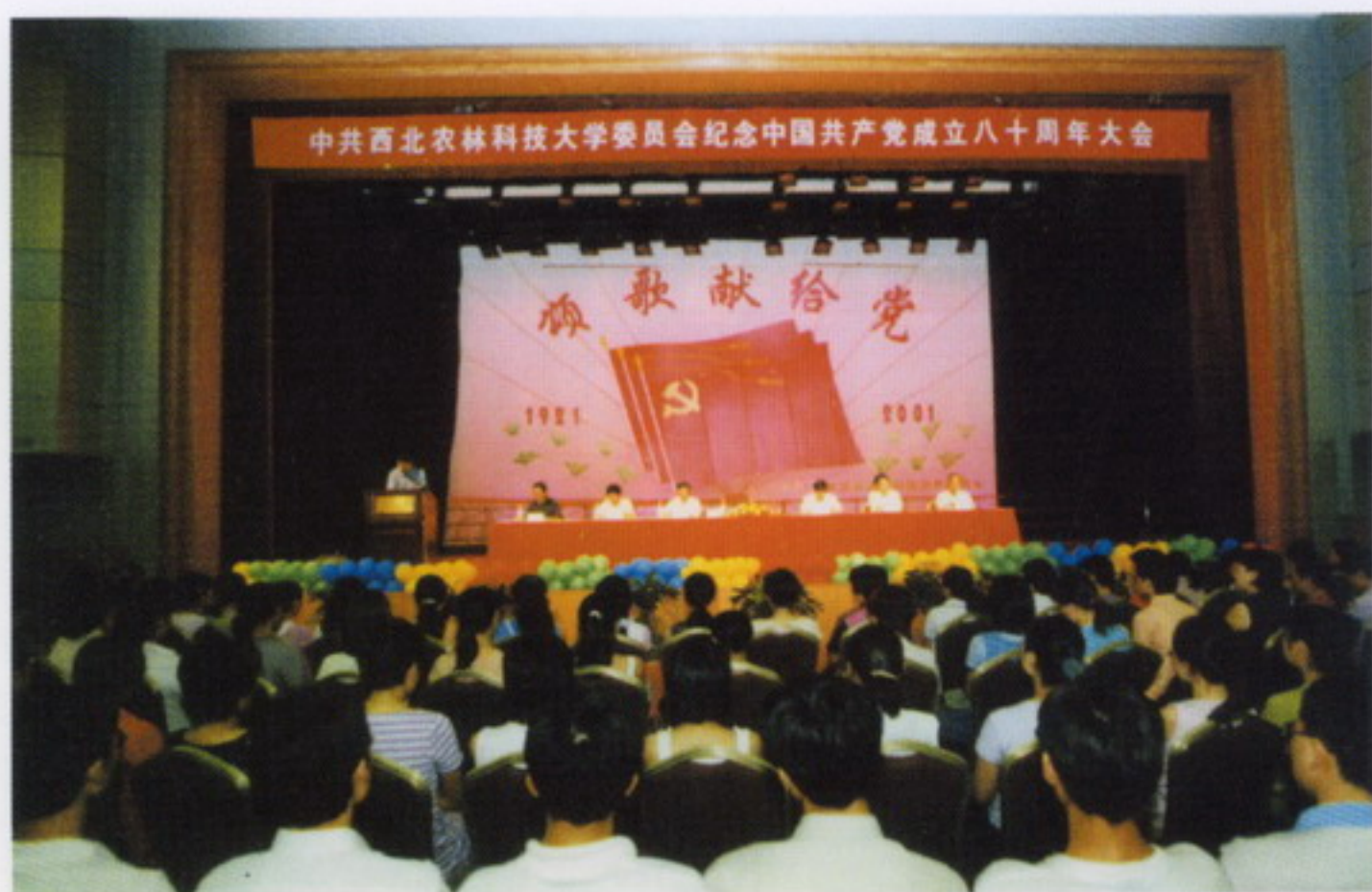
6月29日，学校隆重举行纪念中国共产党成立八十周年大会