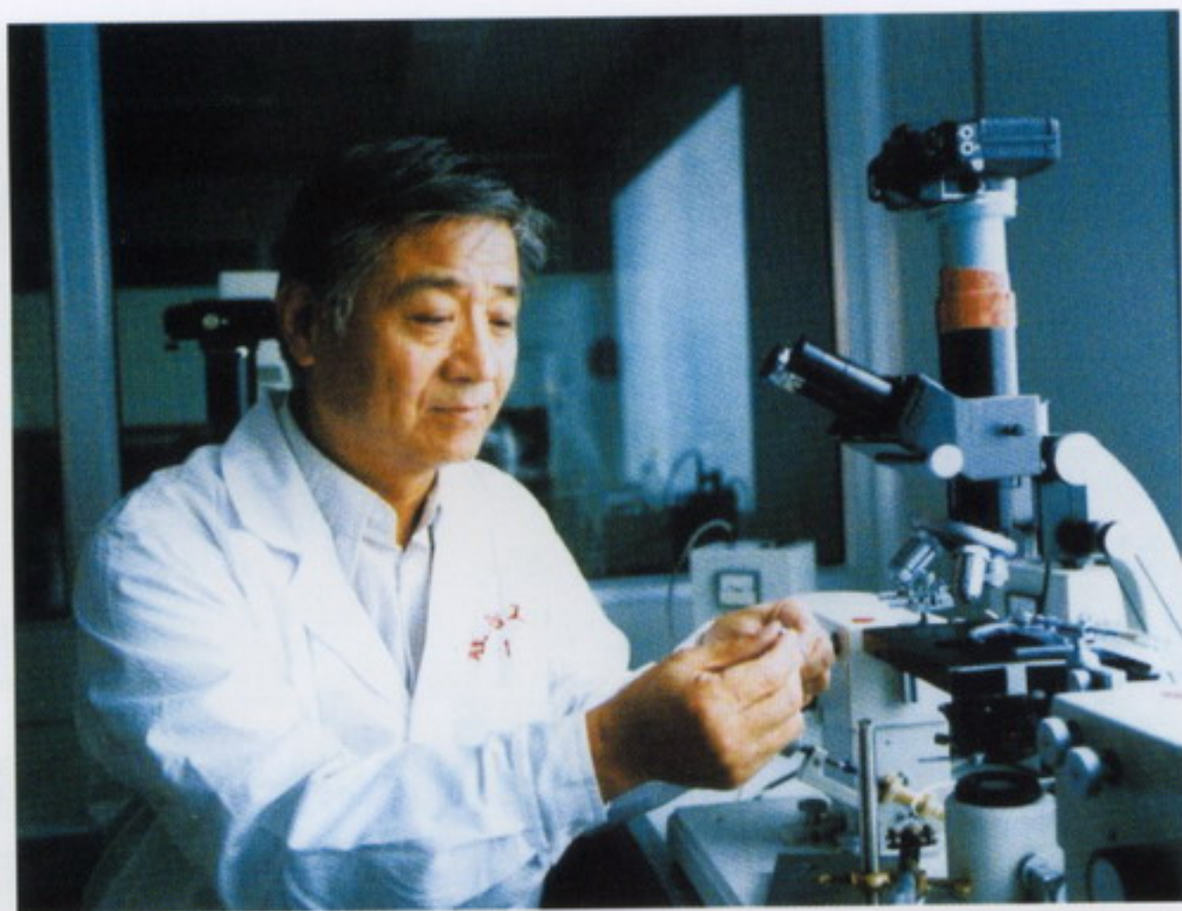
8月31日，窦忠英教授在胚胎干细胞克隆研究领域取得重大进展