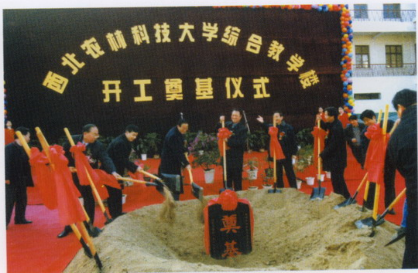
12月28日，学校举行综合教学楼开工奠基仪式