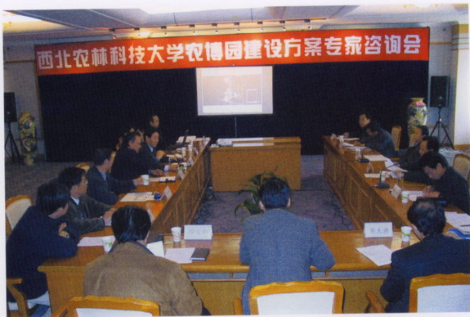
11月19日，学校召开农博园建设方案专家咨询会