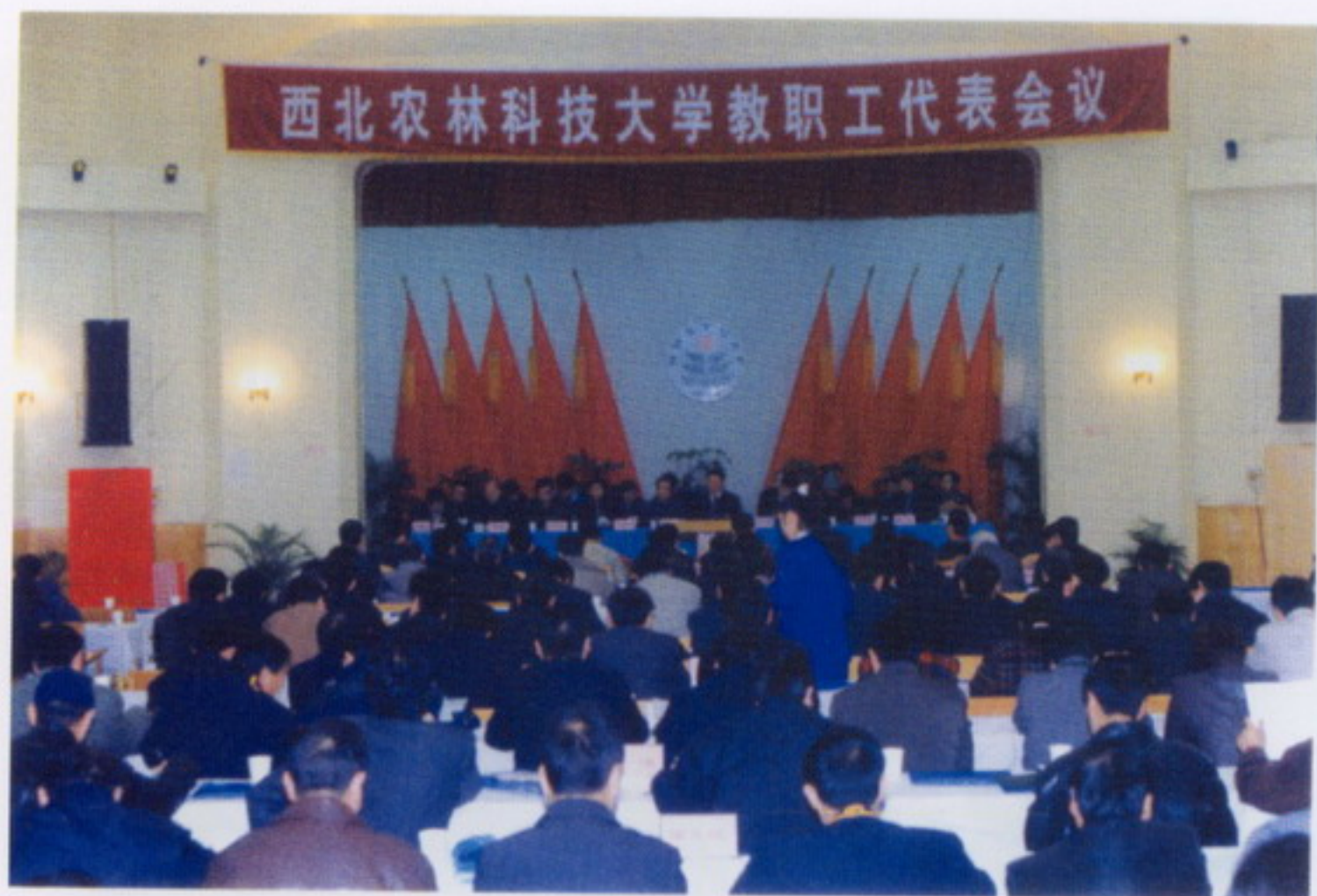
12月15日，学校首届教职工代表大会隆重召开