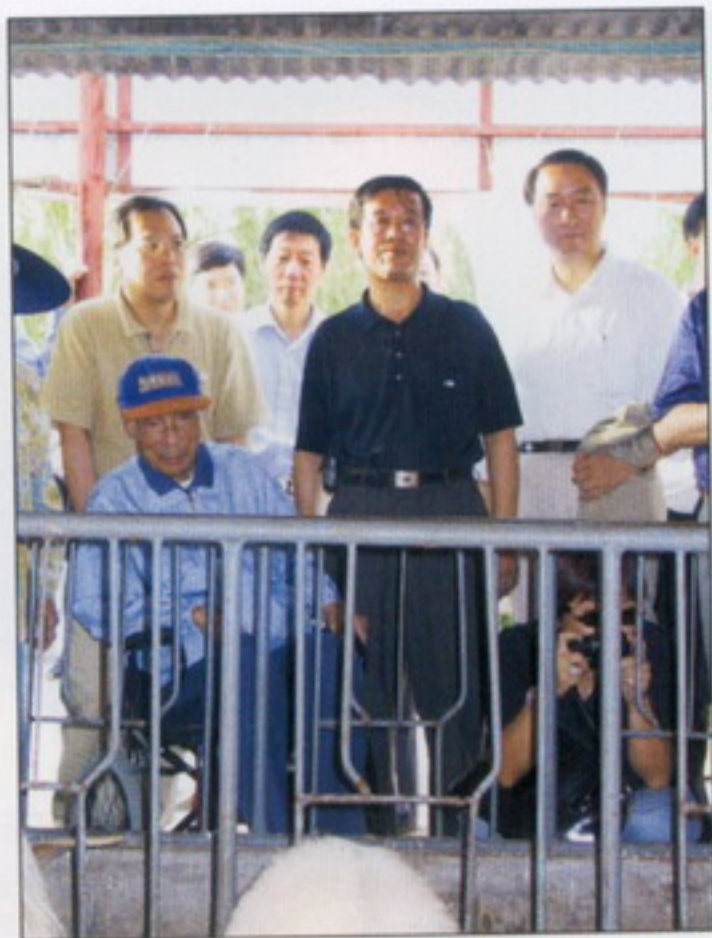
8月25日，香港知名人士邵逸夫先生参观我校克隆羊基地