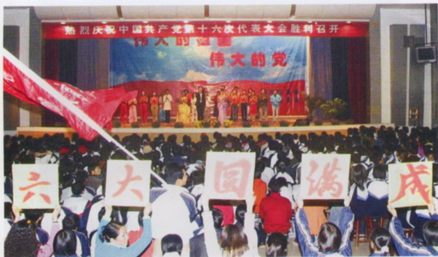
11月8日，学校举行庆祝党的“十六大”胜利召开文艺晚会