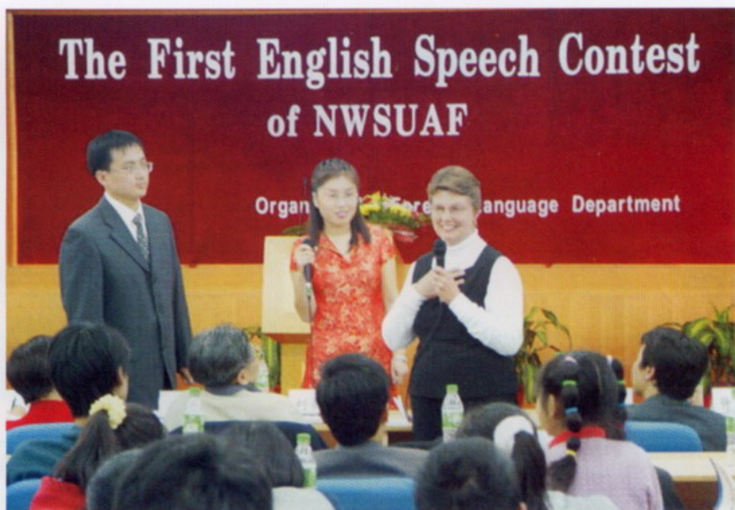
10月18日，学校举办第一届大学生英语演讲比赛