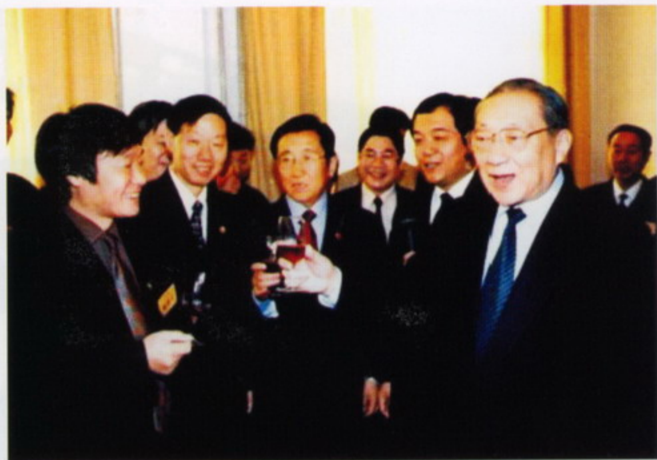
10月24日，中共中央政治局常委、国务院副总理李岚清第五次视察我校