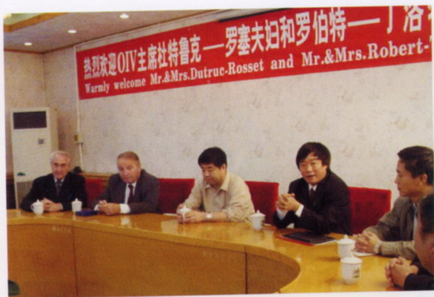
9月13日，国际葡萄与葡萄酒组织(OIV)亚洲葡萄酒科技发展中心在我校成立