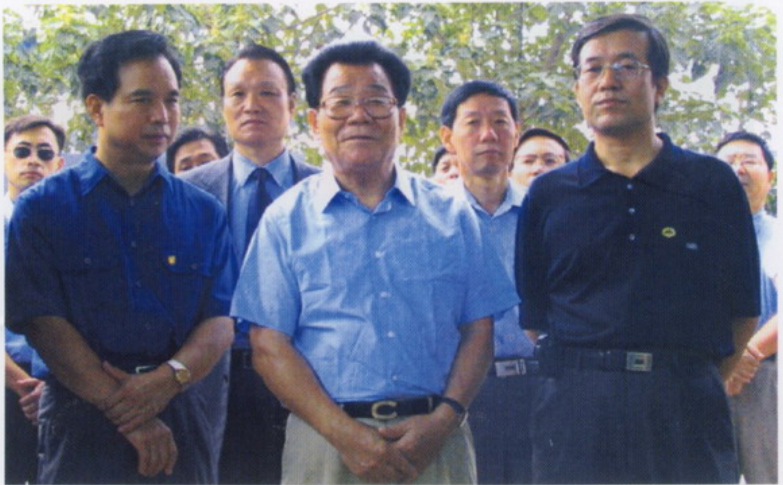
9月9日，中共中央政治局常委、全国政协主席李瑞环视察我校