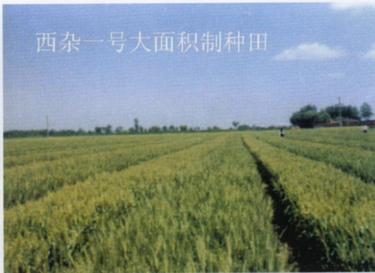
西杂一号大面积制种田