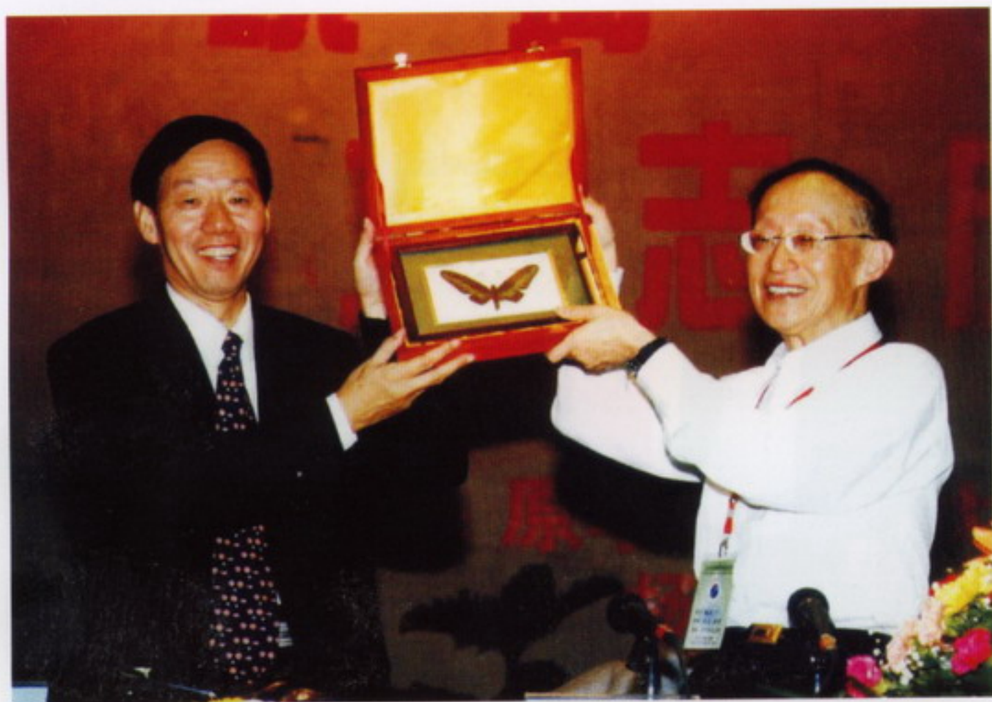
10月14日，党委书记孙武学向来我校演讲的杨叔子院士赠送礼品