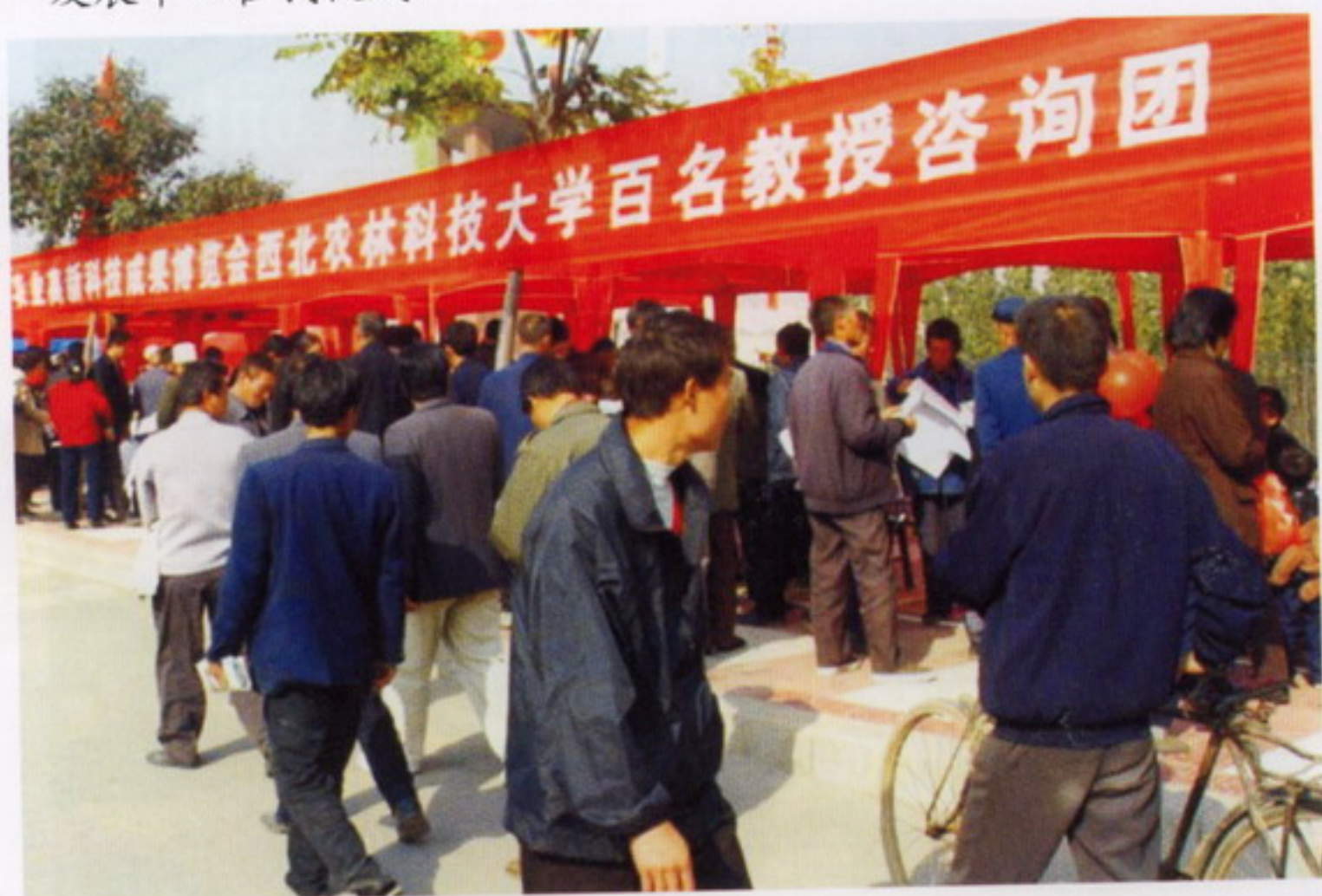
11月6日，学校百名教授咨询团在农高会上