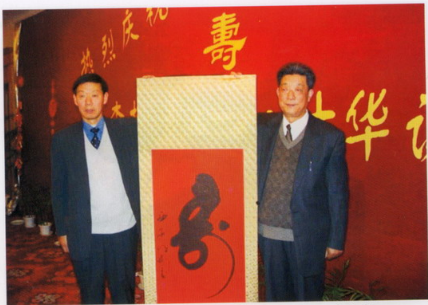
11月16日，学校隆重庆祝李振岐院士八十华诞