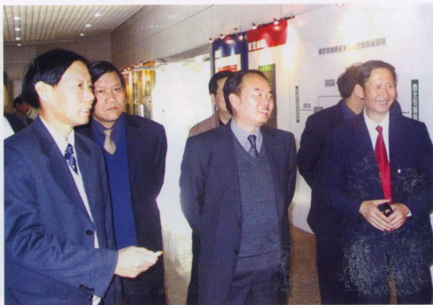
11月5日，教育部副部长周济参观我校展室